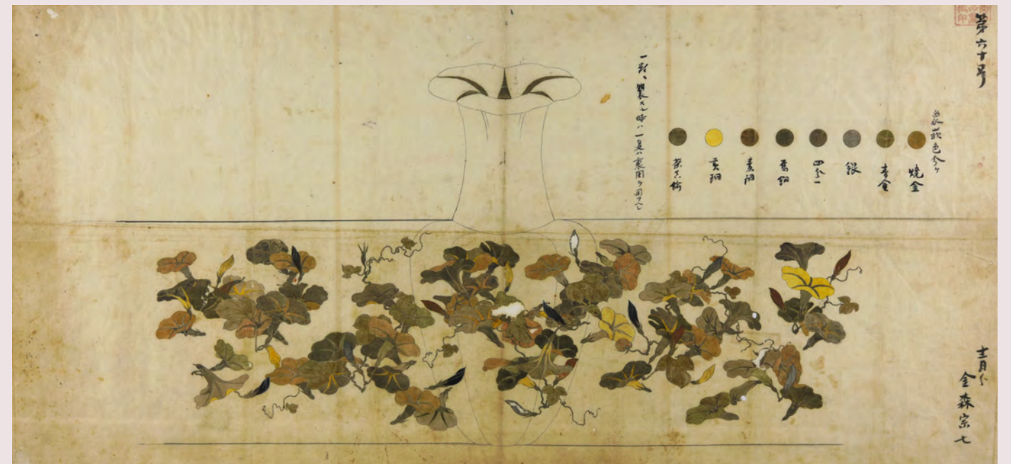
散朝顔文象嵌花瓶下絵(金森家下絵)