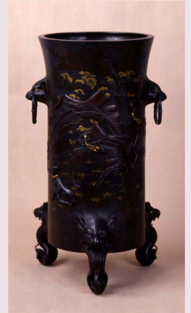
室江吉兵衛《金銀銅象嵌芭蕉に猫文花器》(高岡市美術館蔵)