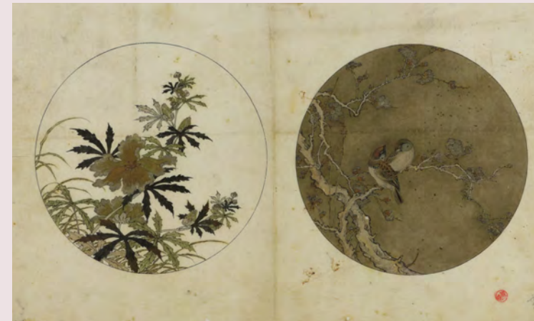
花鳥文扁壺形花瓶下絵(金森家下絵)