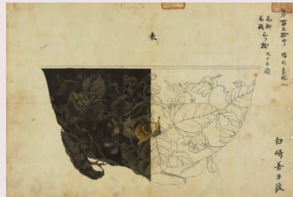
豆に蝸牛文花斛下絵(大橋家下絵)