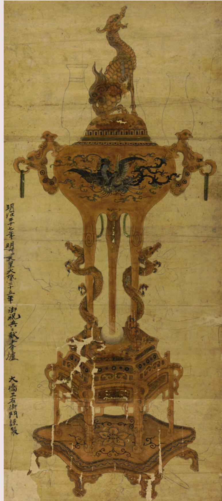
古銅龍巻香炉下絵(大橋家下絵)

富山県高岡市の伝統的工芸品である高岡銅器の歴史は江戸初期の高岡開町とほぼ同時にはじまります。