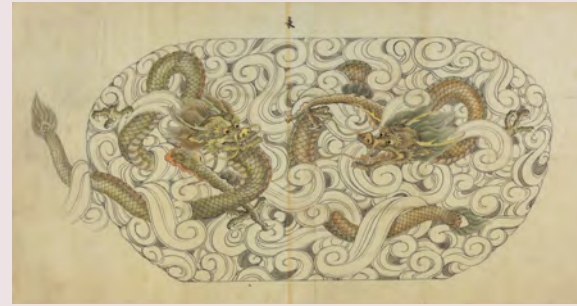
雲龍文図(大橋家下絵)