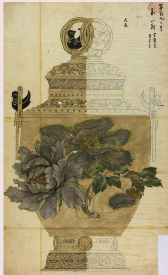
牡丹文壺下絵(大橋家下絵)